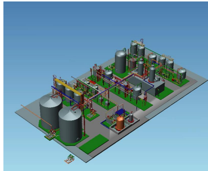
Einfacher Export kompletter Anlagen oder Fabriken

Mehrkosten z.B. an einen Vertriebsmitarbeiter oder Kunden übertragen werden.