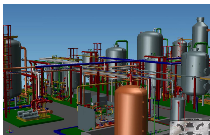
Komplexe Anlagen oder Fabriken interaktiv betrachten und Feedback weiterleiten

Interaktive Ansicht MPDS4 REVIEW bietet Funktionen für Vollbild, Vorder-, Rück- und Isometrie-Ansichten. Außerdem beinhaltet es zusätzliche Kontrollfunktionen für Winkelsichten sowie Vorder- und Draufsicht-Achsen, Modellrendering, Schatten- und Hintergrundfarben.