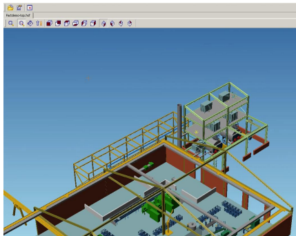
MPDS4 Projektdaten mit einer unabhängigen Anwendung aufrufen

MPDS4 REVIEW ist eine professionelle Standalone-Anwendung zur gemeinsamen Nutzung und Betrachtung kompletter MPDS4-3D-Planungsdaten mit Kunden und Lieferanten. Anwender können damit ihre MEDUSA4 3D- oder MPDS4-Modelle interaktiv betrachten, virtuelle Anlagenrundgänge durchführen, ihre Konstruktionen im Detail überprüfen und Änderungswünsche weiterleiten.